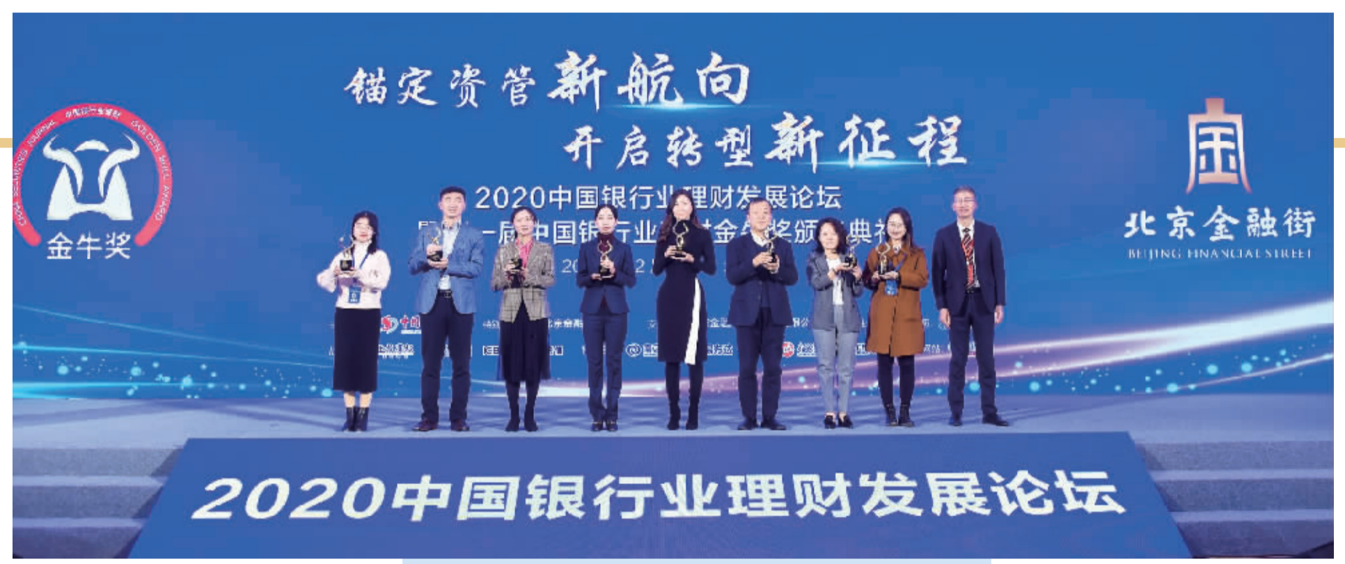
理财银行金牛奖颁奖现场