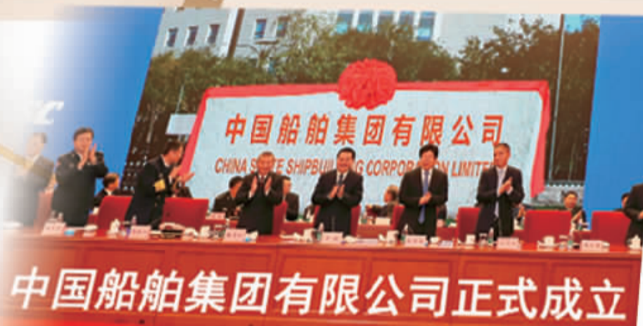
中国船舶集团有限公司正式成立